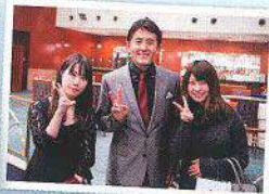
各テーブルに鉄穴社長がご挨拶へ回り、お客様と記念撮影