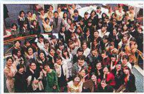
最後は会場の会員様とスタッフ全員で「恋文ちゃんポーズ」！皆様有難うございました