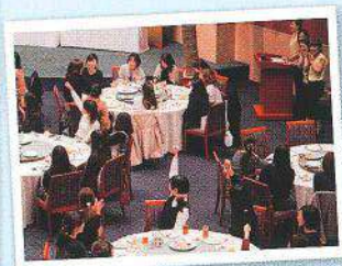
ヴィトンが景品に加わり、じゃんけん大会で白熱の会場