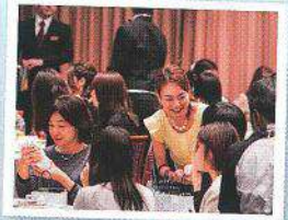
各テーブルにスタッフが回ってお渡ししました