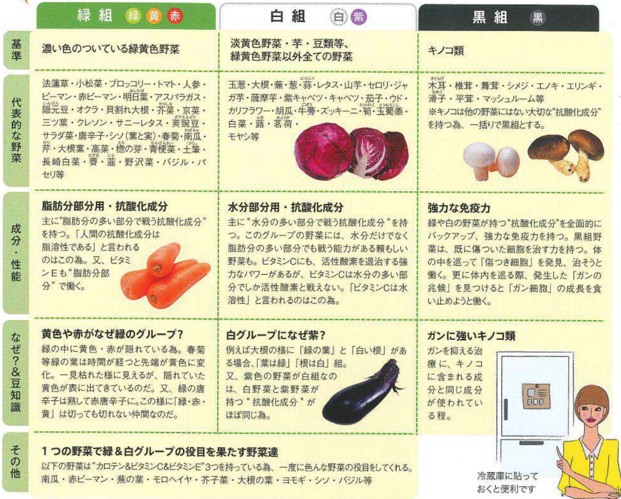
冷蔵庫に貼っておくと便利です

右ページ「食べ方」で紹介している「野菜の組み分け表」が以下。 冷蔵庫に貼っておくと便利。